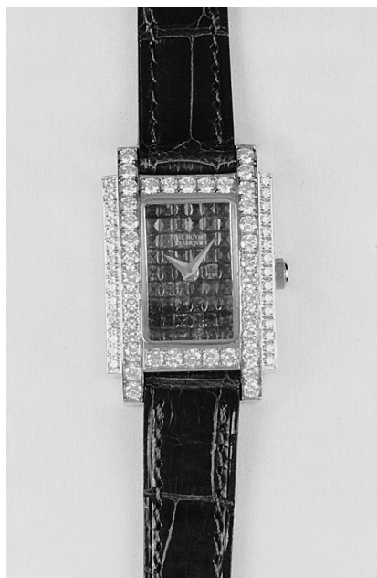
no BA 84