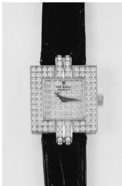
no BA 83